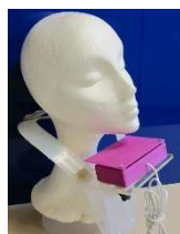
Ratón y pulsador. Imágenes obtenidas del "Catálogo de pulsadores, soportes y otras adaptaciones". Editado por el CEAPAT Imsero.

A veces los dispositivos de acceso son tan necesarios como el propio comunicador o programa informático de comunicación.