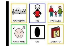
Pictogramas de ARASAAC

El lenguaje también se puede representar mediante imágenes y por eso muchas personas utilizan sistemas pictográficos.